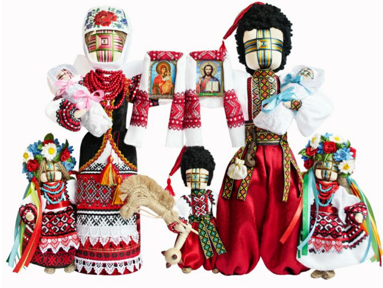
Виготовлення української народної ляльки-оберега майстер-клас